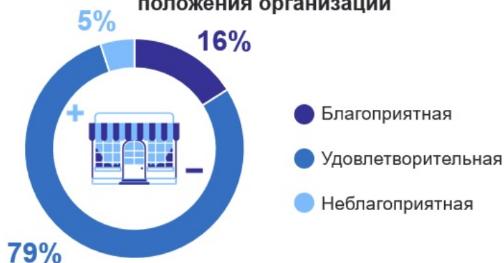
Оценка общего экономического положения организации