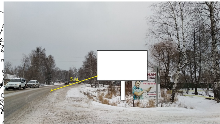
Система координат МСК-18