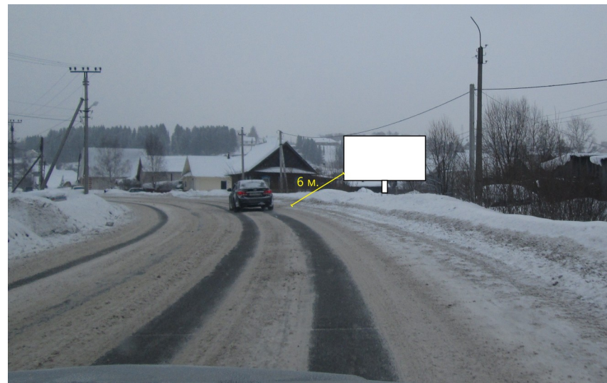
Система координат МСК-18

Утверждена Постановление Администрации МО «Муниципальный округ Игринский район Удмуртской Республики» от _____ № _____