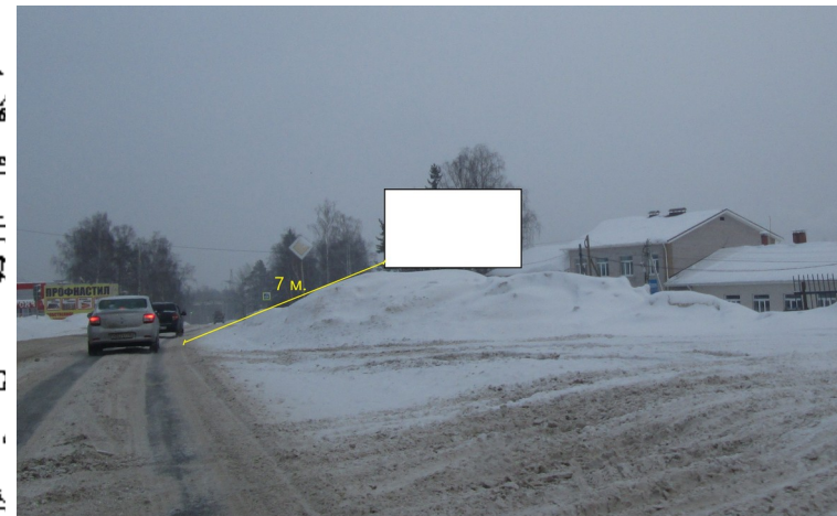
Система координат МСК-18